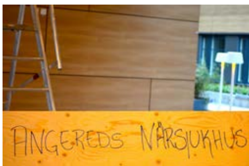
Allt är inte riktigt på plats än.

I Sverige är medellivslängden omkring 82 år. Men inte om du bor i Angered i nordvästra Göteborg. Där ska du vara glad – i alla fall enligt statistiken – om du får fira din 74 årsdag. Politiker, hälsomyndigheter och allmänheten var rörande överens: något måste göras.