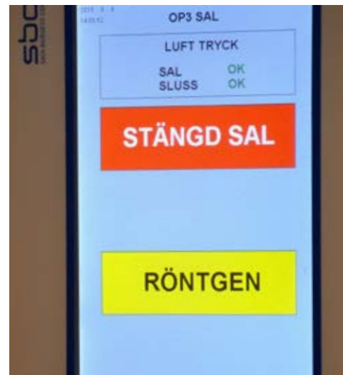
Det ska vara lätt att göra rätt. Displaypanel visar vad som pågår i salen.

>>> ansvar för energisamordningsfrågor och VVS, förklarar: "Angereds Närsjukhus har ett energikrav på 70 kilowattimmar per kvadratmeter och år. Genomsnittet i Västra Götalandregionens lokaler är 185 kilowattimmar."